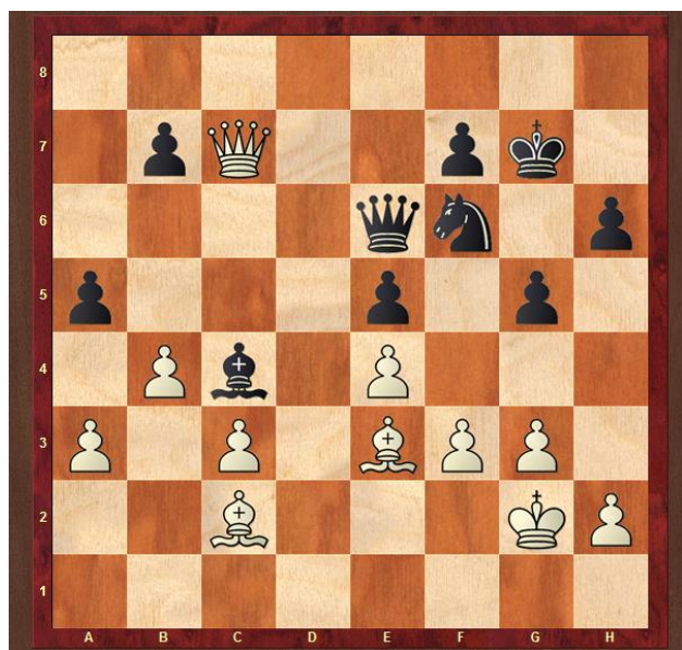
Рисунок 1. Тема «Завлечение». Ход черных

1. ... Фh3+!! Белые сдались, поскольку выбор невелик: 2. Кр:h3 – Cf1X или 2. Крh1 – Фf1+ 3. Сg1 – Ф:f3X, или 2. Крf2 – Фf1X.