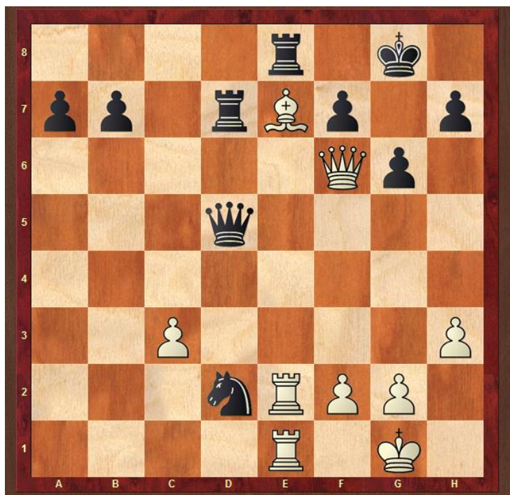
Рисунок 2. Тема «Завлечение». Ход белых

1. Фh8+! Черные сдались. При взятии ферзя королем последует 2. Cf6+ - Kpg8 3. Л:e8X с матом.